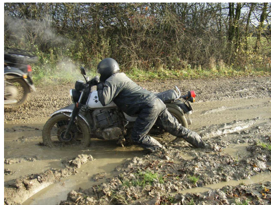
Voor de echte avonturiers is de zandpadentoertocht een jaarlijks terugkerend evenement

Ons clubblad de Pruttelpot ploft zes keer per jaar op de deurmat. Dit blad staat vol reis- en sleutelverhalen, evenementen en advertenties van vraag en aanbod tussen leden.