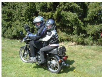
MZ: voor jong en oud!