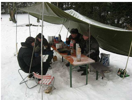
Even warm worden tijdens het wintertreffen

Jaarlijks zijn er een aantal evenementen zoals toerritten, sleuteldagen, enz. Deze evenementen zijn veelal met een kampeerweekend. Je eigen eten koken, een kampvuur en een goed gesprek laten je even het "drukke" leven vergeten. Bij deze gelegenheden worden uiteraard allerlei wetenswaardigheden aangaande de MZ'ten uitgewisseld en vriendschappen gesloten. Het motto van de club is dat iedereen zich op zijn gemak voelt. Steeds meer gezinnen met kinderen komen op de kampeerweekenden. De MZ club Holland is een club waar "niks moet, alles mag".